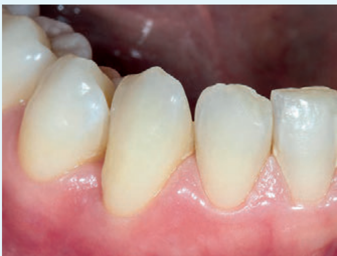
Fig. 3 Caso 1: ascesso parodontale, controllo a 7 giorni