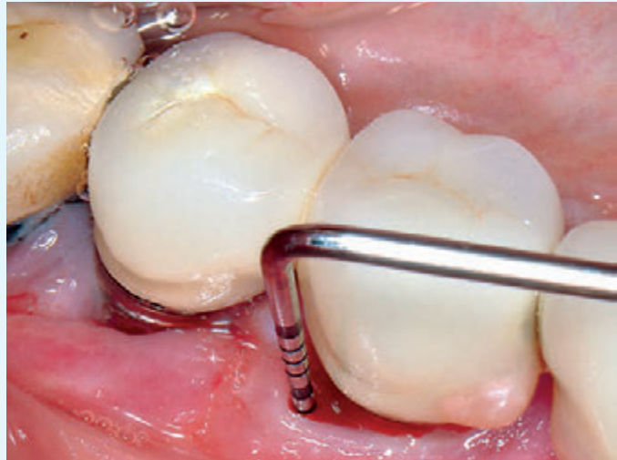
Fig. 9 Caso 2: perimplantite, sondaggio al basale