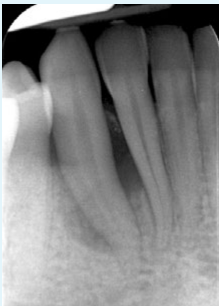
Fig. 5 Caso 1: ascesso parodontale, radiografia al basale