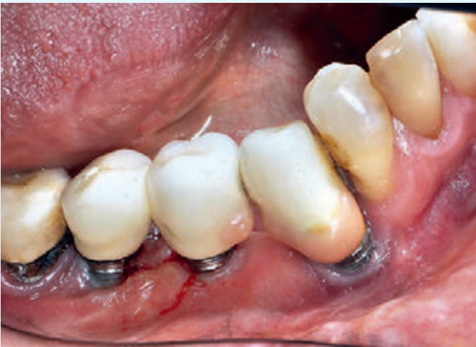
Fig. 10 Caso 2: perimplantite, aspetto clinico a 12 giorni