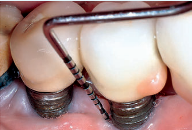
Fig. 12 Caso 2: perimplantite, aspetto clinico e sondaggio a 1 anno