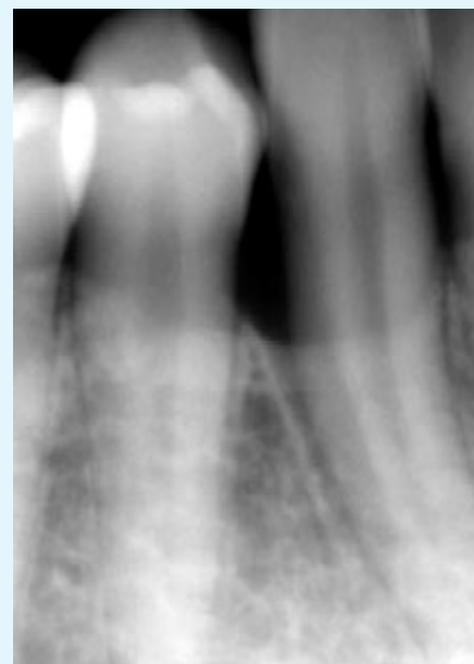
Fig. 7 Caso 1: ascesso parodontale, radiografia di controllo a 1 anno

zione completa dei sintomi (dolore, gonfiore, fistola, rossore), dopo una settimana si riscontravano una riduzione della profondità di sondaggio pari al 50% in media, l'assenza di essudato purulento, la riduzione o scomparsa del sanguinamento al sondaggio e la bonificazione dei tessuti molli. Ciò permetteva di eseguire la terapia non chirurgica adeguata in una situazione clinica ottimale e, in particolare nei casi di perimplantite, la seconda applicazione di doxiciclina al