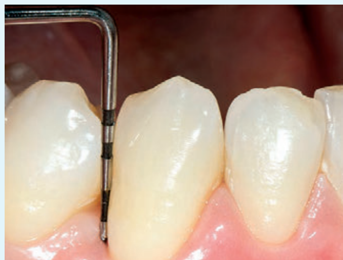
Fig. 4 Caso 1: ascesso parodontale, controllo a 3 mesi