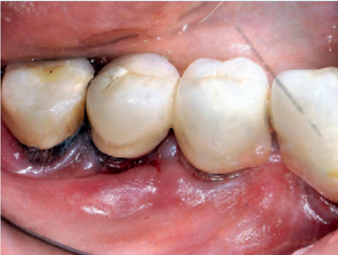
Fig. 8 Caso 2: perimplantite, aspetto clinico al basale