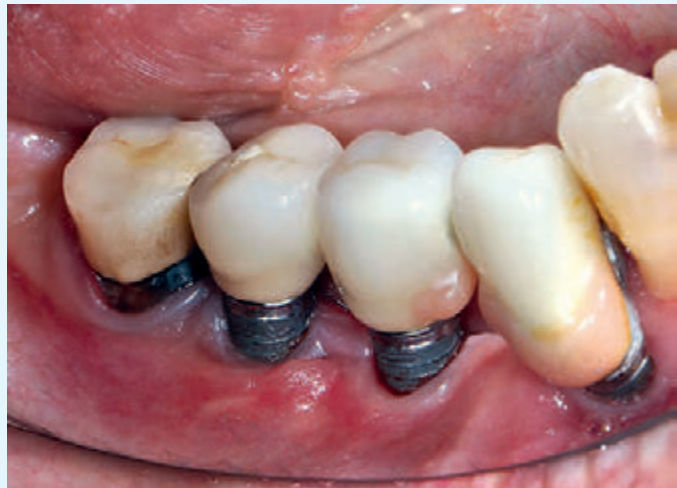
Fig. 11 Caso 2: perimplantite, aspetto clinico a 3 mesi