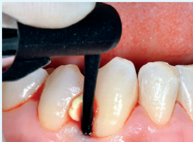
Fig. 2 Caso 1: ascesso parodontale, applicazione di doxiciclina 14%