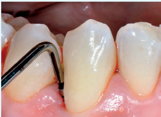
Fig. 1 Caso 1: ascesso parodontale, sondaggio al basale

L'esperienza personale nell'utilizzo di doxiciclina al 14% nel trattamento degli ascessi parodontali e perimplantari e in associazione alla strumentazione non chirurgica nella terapia delle perimplantiti croniche ha mostrato risultati molto incoraggianti con risoluzione del problema (chiusura delle tasche, scomparsa del sanguinamento e dei sintomi) in tempi brevi. A 48 ore dal drenaggio dell'ascesso attraverso la tasca e dall'applicazione dell'antibiotico si aveva la risolu-